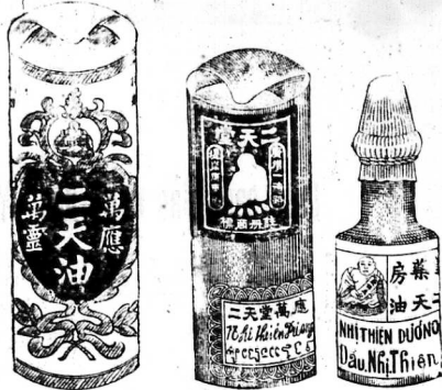
Đầu bán tại Hongkong