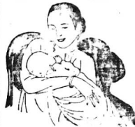
Một ảnh đồ bộ chương trình... (caption for the illustration)