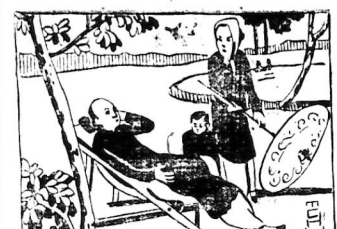
Hà Bất-đồng nam... Ngoại vụ