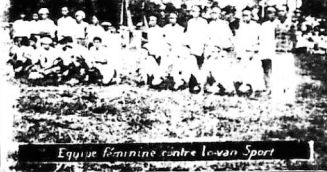
Equipe Française Centre I-ven Sport

Hôm trước chúng tôi có đăng bài kể chuyện trên đây của gia đình bạn trẻ đản bà Cai-von với đôi bạn trẻ trong họ tên. Chúng tôi hôm nay xin hiển đề-giả-tâm hồn trên đây, chúc hai bạn ấy lập nghiệp thuận đ.