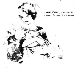
AUX JEUNES MÈRES