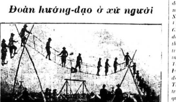
Đoàn hướng-đạo ở xứ người

ở trường 8, Thủ-thuyết: Vô Phi Long của VĂN-SY.