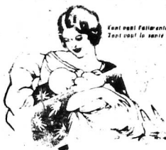
Vous ne pouvez l'atteindre que par la route de la perfection. Tout est le fruit de la perfection.