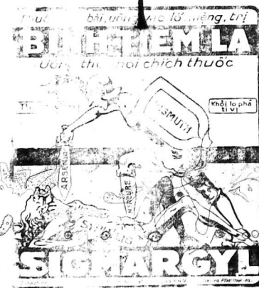
Saigon 1. SAIBHAT, Pharmacien Normale. 2. MUR, Pharmacien Centrale.