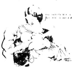
AUX JEUNES MERES