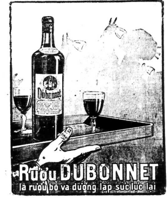
ĐẠI LỢI ĐỘC QUYỀN Compagnie Optory. SAIGON

X. Bởi vì người mình ở Pháp... Một buổi nói chuyện với ông bác vật V.