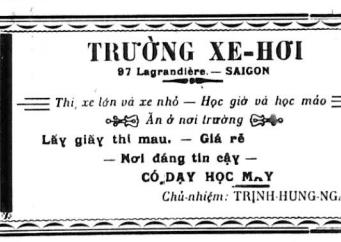
TRƯƠNG XE-HƠI 97 Lagrandière - SAIGON