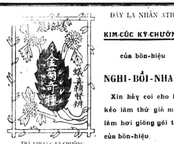
NGHI-BÔI-NHAM 75, Rue des Jardins - CHOLON cũ