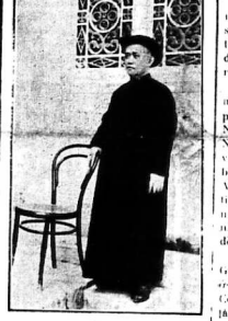
Hình ảnh Đức tôn Giám-mục J. B. TÔNG khi Ngài còn đang làm chức phó phủ Tân-thị

Từ ngày Tòa- thành lan quyền... (text continues with news reports regarding local and national events, including mentions of the French colonial administration and local figures.)