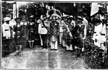
Ảnh của M. Autret hàng L'Union gần chợ Bưởi Hà.

Dục Báo-Dại đến Touraine để được lên to quốc.