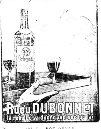
RAI L. ĐỐC QUYỀN Compagnie Optorg. - SAIGON

Loi khinh-hạ tại loan cưa mở ngày 26 Jun 1933 thì sẽ chẳng đồng thuận chấp. Tôi tự thấy rằng việc tra cứu này cũng như việc tra cứu về diện tích đã được trong địa bộ của làng Bình-phước, tổng Hòa-hảo, hạt Mỹ-tho.