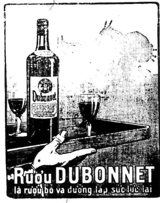
RƯỢU DUBONNET là rượu đỏ và đường lạp sức lực lại