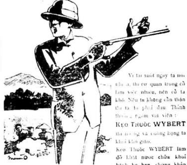
Wybert KEO THUỐC WYBERT