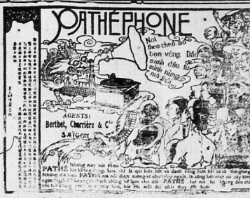
Tại hàng có hơn 1 triệu đĩa hát đủ các thứ tiếng