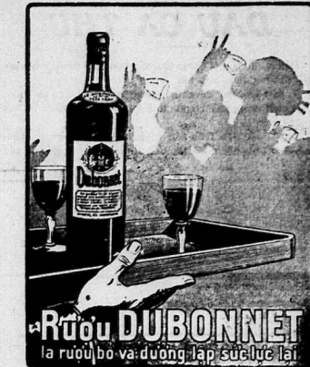
ĐẠI-LY ĐỘC-QUYÊN Compagnie Optogr. — SAIGON