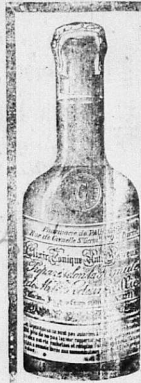
PHẢI DUNG THUỐC BỔ VÀ TRỊ ĐAM THIỆT HIỆT LA ELIXIR TONIQUE ANTIGLAIREUX

TẠI NHÀ IN ÔNG F.-H. SCHNEIDER 7, Boulevard Nordam SAIGON