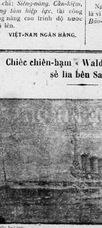
Chiếc « Waldeck Rousseau » là một chiến-hạm chiến trận lớn đã được đặt tên tại một mục-đích cũ hình-dạng là thế nào rồi. Thứ xem qua cái hình trạng này thì biết sự, như là hình một chiếc tàu mà có cái cái ống-khói thì biết sự.

Chiếc « Waldeck Rousseau » là một chiến-hạm chiến trận lớn đã được đặt tên tại một mục-đích cũ hình-dạng là thế nào rồi. Thứ xem qua cái hình trạng này thì biết sự, như là hình một chiếc tàu mà có cái cái ống-khói thì biết sự. Đã ngày 15 Janvier 1931 thì chiếc chiến-hạm « Waldeck Rousseau » sẽ rời bến Saigon, chuyển ra đi về các nơi khác ở ngoài Trung-kỳ.