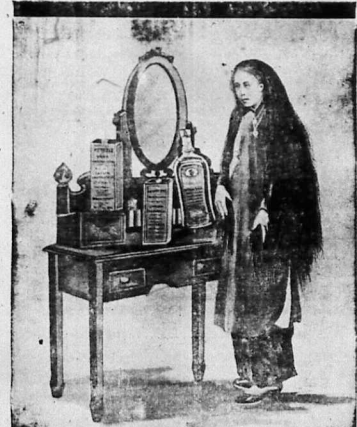
Nhờ dầu PÉTHOLE HAHN mà tóc của tôi dẹt sạch sẽ và mịn màng

kẻ ấy chó sao... Đông-Đài điếm số ba trăm năm... Đông-Đài điếm số ba trăm năm