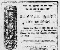
Đội được phòng L. SOLIENS, Saïgon

Xin hàng bán chiếu có... KHÁNH-KY - Photo