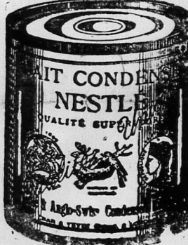
NESTLÉ'S MILK CONDENSED