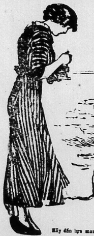
Phải lòng đắm đắm các kìa ra cho chữ tên chạp lỵ.