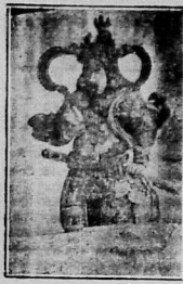
Truyện Phật Thích Ca

Để tránh tai nạn giao thông, xin lưu ý các người dùng xe hơi khi đi qua các đường phố.