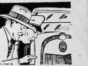
Số báo này trọn đủ với sự lạc hậu cách đây rất lâu... xe Langsa, xe Unic, xe Citroën...

Chúng ta đã có niềm... phải nói là niềm tin, niềm tin vào quê hương, niềm tin vào tương lai. Chúng ta cần phải thương mến quê hương, thương mến quê hương của mình. Quê hương là nơi chôn cất xương, là nơi ta sinh ra và lớn lên. Quê hương là nơi ta tìm thấy sự bình yên, là nơi ta tìm thấy sự hạnh phúc. Vì vậy, chúng ta cần phải thương mến quê hương, thương mến quê hương của mình. Chúng ta cần phải thương mến quê hương, thương mến quê hương của mình. Quê hương là nơi chôn cất xương, là nơi ta sinh ra và lớn lên. Quê hương là nơi ta tìm thấy sự bình yên, là nơi ta tìm thấy sự hạnh phúc. Vì vậy, chúng ta cần phải thương mến quê hương, thương mến quê hương của mình.