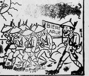
Chơi bài: Quân làm biển! Phải chi bằng uống rượu "Bière Larue" thì chơi đâu mà hết đùa thế này