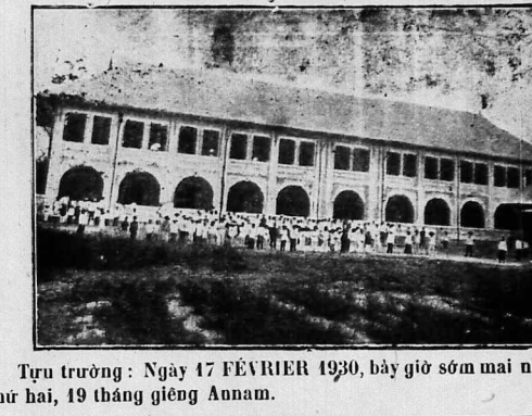
Tự trường: Ngày 17 FÉVRIER 1930, bảy giờ sớm mai...