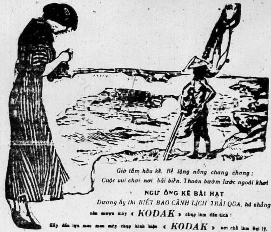
Giờ làm hầu kẻ. Bà lòng nặng chàng chàng. Cuộc vui chơi nơi bãi biển này. Hoàn bươm lược ngoài khơi