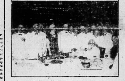
Ảnh chụp khi nhà đại thi-si TAGORE đi tiếp rượu tại đình Đốc-ly Thành-phố Saigon