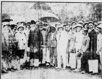
Ảnh chụp khi nhà đại thi-si TAGORE ở dưới tàu bước lên