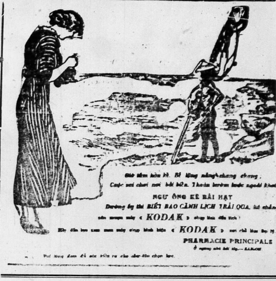
Đầy Đàng Cho các Viên-Quan Bần-hieu có tiếp đàng bin Pháp mới...