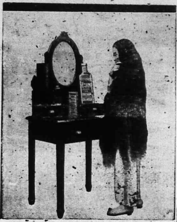
Nhỏ dẫu PETROLE HAHN mà tốc của tốt dụng sạch sẽ và mĩnh màng.