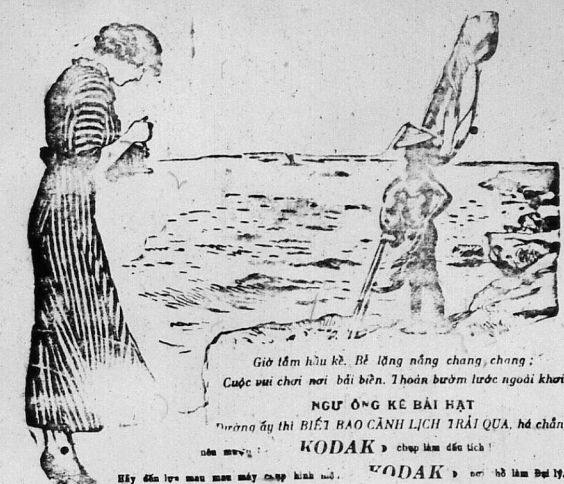
Giờ làm hầu kẻ... Cuộc vui chơi nơi bãi biển... NGŨ ÔNG KẾ BÀI TRẠI Đường ủy thị BIẾT BAO CẢNH LẠI TRẠI QUẢ, hã chúng nhớ sự... KODAK chụp làm dấu tích! HÃY ĐÓN LẠI MÀN MÀNG MÂY CẤP HINH... KODAK... P... PRINCIPALE SAIGON.