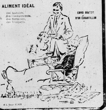
Được nuôi bởi Phoscao

L'Union Commerciale Indochinoise & Africaine