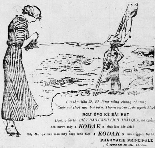
Giờ tắm hầu kẻ. Bể lững lờ nắng chang chang; Cặp voi chơi nài bãi biển. Thôn bươm lượn người khời

Laboratoires Maurice ROBIN, 13, Rue de Polisy, PARIS