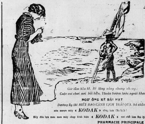
Giờ làm hầu hết. Bể lửng nóng chung chung: Cuộc vui chơi nơi bãi biển. Thoản bươm bướm trước ngoài khơi