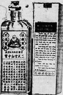
nhằm mà rất quý về vậy thì phải biết thuốc Huyết-Trung-Bầu là quý báu... Còn người huyết hư... Còn người huyết hư... Còn người huyết hư...