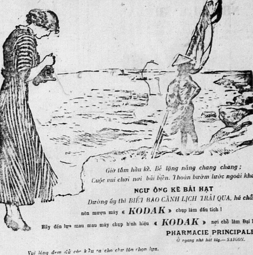
Giờ tầm hầu k. Bế lừng nung chàng chàng; Cuộc vui chơi nơi bãi biển. Thoaon bươm bướm ngoài khơi NGƯ ỜNG KỀ BÀI HẠT Đương ấy thì BIẾT BAO CẢNH LỊCH TRÁI QUẢ, há chẳng nên mừng may « KODAK » chụp làm dấu tích! Hỡi đến lữ mau may chụp hình hiệu « KODAK » nơi chớ làm bại Ự. PHARMACIE PRINCIPALE ở ngang nhà hát Saig. Vải lăng đem đủ cỡ K và ra cho đẹp tìn chọn lựa.