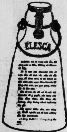
Có thể bán tại nhà thuốc SOLAIRE.

HÀNG L'U. C. I. A. 21, Đường kinh lý, Saigon