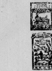
Sách in rời lần thứ nhì