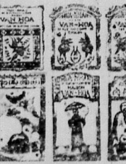
Sách in rời lần thứ nhì