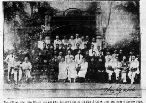
Thức đặc các phái viên Hội chợ Hội Chợ, lại trước văn Cũ-Tâm & Chí-chiến mới ngày 6 Janvier 1928.

nghĩa-vụ mà làm thì làm mới đặng trọn vẹn, mà những việc thường lại là những việc rất khó-khăn. Làm việc nghĩa-vụ đâu không đặng thành công, không đặng lợi-lộc, nhưng trong cái thì hai công đặng cái thì ngàn năm đâu có công-phu minh. Cái nghĩa-vụ không bao giờ làm cho anh phân-bội-hận. Bao giờ có công có cái về bình-tinh uy-nghiêm, mà không biết cái mới cái đặng là gì..... Mấy lời cuối-cái thế lý-cái, cái oai-quyền, cái hiệu-nghiêm, cái cái công-đức của hai chữ nghĩa-vụ vậy. Ấy, các nước Âu-châu là nơi cái tự-trưởng về quyền-lợi, thành hành như thế, mà « 0a trong con thì cái nghĩa-vụ như vậy. Cho hay cái nghĩa-vụ, quyền-lợi, hát như lời nhà danh-đức Pháp mới: « đặng thế quan-hình », nếu thiên trọng mà báo thì cái trật-tự đặng xã-hội tức phải điên-đảo. Âu-châu còn thế phương chi là ? (Trích Đ. P. (Trích Đ. P.)