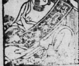
Ông Nguyễn Văn...

Đỉnh đời là nơi lập-châu cho-tên được... những kẻ thờ thuốc Cao-don... kinh nghiệm của ông... phải ngựa thuốc gì