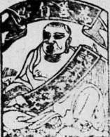
Đỉnh Mễ Mễ... VIỆTSANH... Đỉnh Mễ Mễ...