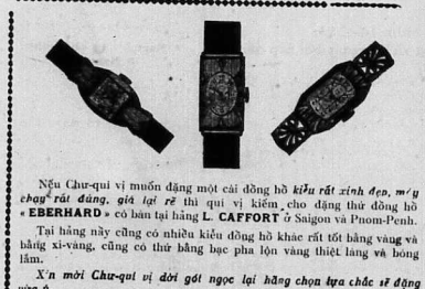
Như Chư-qui vì muốn tặng một cái đồng hồ...