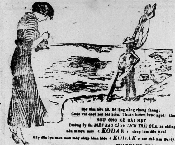
Đồ tìm hũu hũ. Bề lộng nểng chàng chàng; Cuộc vui chơi mới bắt đầu. Thơm hương nước ngoài, kẻ NGỒU NGỒU BÀI HẠT...