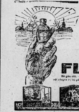
Cá trở bán tại PHARMACIE PRINCIPALE L. SOLIÈRE, trước nhà hát Saigòn.

Thước-kỷ-TS năm lại nhà thương... (Text describing the 'Hồi Thờ Bốn Mươi Lam' ceremony)