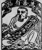
Ông là ông... (Caption text describing the man in the portrait)

Kính kị 16 rồi lỵ-căn chi... (Text describing the medicine's benefits and warning against counterfeits)