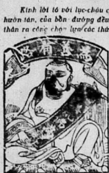
Đây là dấu hiệu của thuốc già... ảnh hưởng rất nhiều đến sức khỏe của người bệnh.

Kính lời là tôi lúc-châu... những cái thuốc Cao-dân... kinh nghiệm của ông lương... VỊ-THIÊN-ĐƯỜNG... CHỖ ĐÓNG MỘT LẠI... NHÌ-THIÊN-ĐƯỜNG... 35 rue de Canton 38 - CHOLON