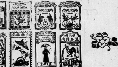
VAN-HOÀ KINH KHAI