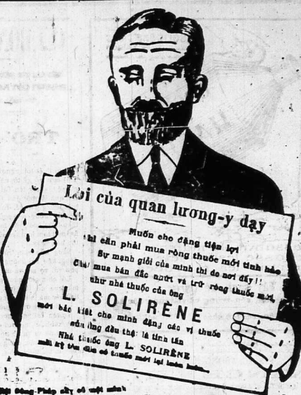
Một Ông Pháp lấy ở một mình... anh thuốc này làm rõ...