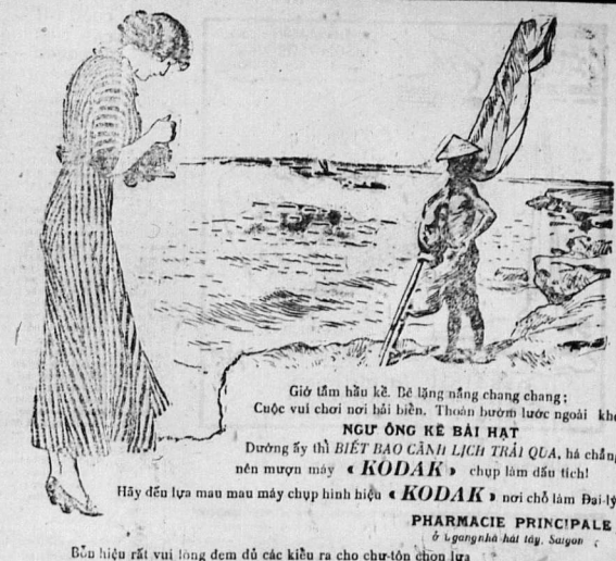
Bầu hiệu rất vui lòng đem đủ các kiểu ra cho chư-tôn chọn lựa.

KHÔNG CON hay là đũa-ho KHÓ CHIEU THAY thì chứa kàng thuốc YXALINE. Thuốc này nhỏ vào sông cũng đượ.