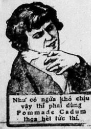
Như có người khổ chịu vậy thì phải dùng Pomade Cadum...

NƯỚC SUỐI TỰ-NHIÊN LẤY TẠI MẠCH VICHY CELESTINS