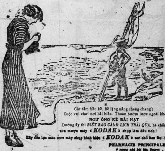
Mỹ của lên mau mau này chụp hình hiện « KODAK » mới cho làm đẹp-lại.